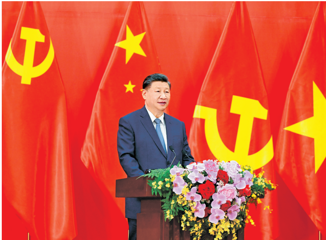
当地时间十二月十三日下午,中共中央总书记、国家主席习近平和夫人彭丽媛同越共中央总书记阮富仲夫妇共同会见中越两国青年和友好人士代表。这是习近平发表题为《赓续传统友谊,开创中越命运共同体建设新征程》的重要讲话。