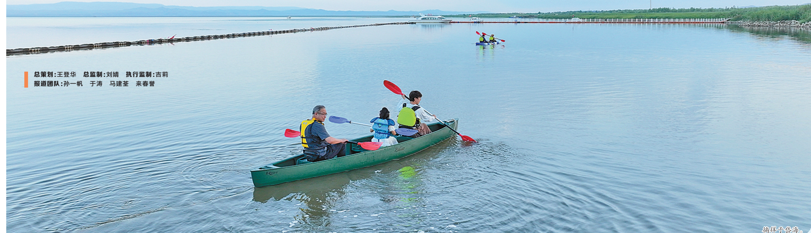
总策划：王登华 总监制：刘婧 执行监制：吉莉 报道团队：孙一帆 于涛 马建基 来春普