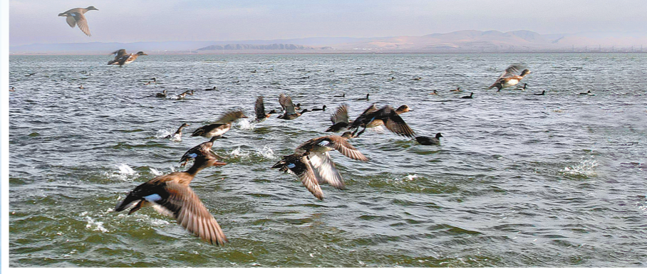
岱海成为候鸟迁徙途中的重要驿站。