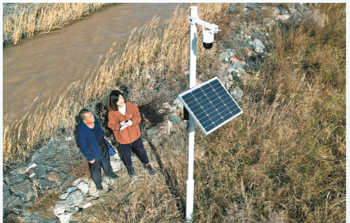
工作人员监测水位、水流量。