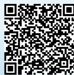
更多精彩，扫描二维码

答好黄河“几字弯”的“绿色答卷”，在祖国北疆构筑起万里绿色长城，内蒙古奋力书写新时代生态文明建设新篇章。