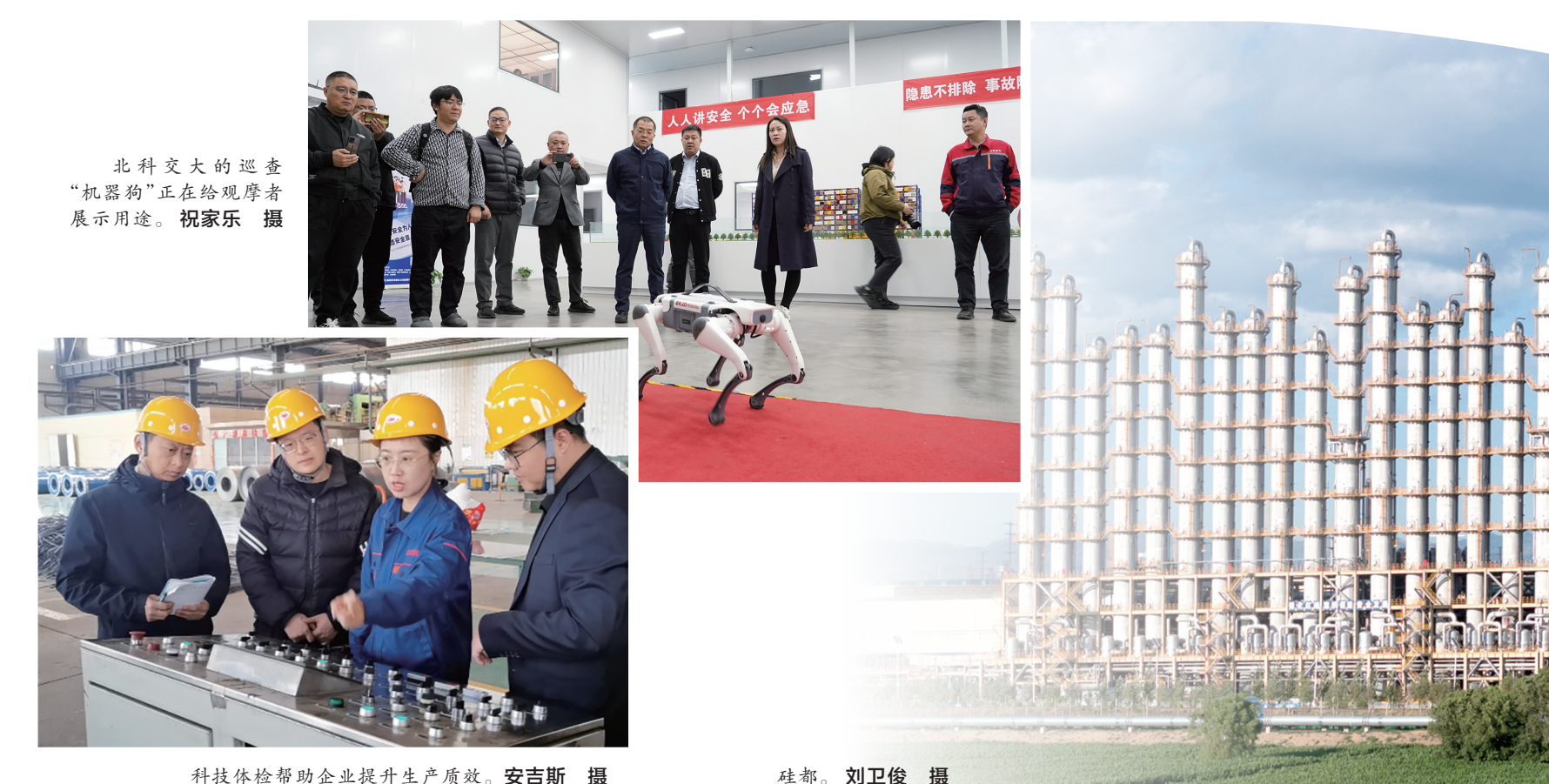
北科交大的巡查“机器狗”正在给观展者展示用途。