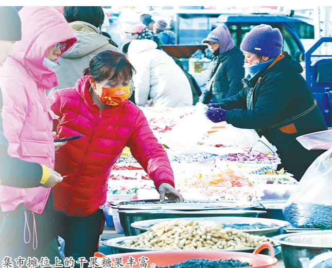
集市摊位上的干果糖果丰富。