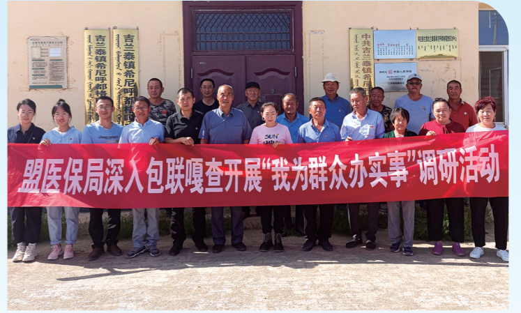
阿拉善盟医保局深入包联嘎查开展“我为群众办实事”调研活动。