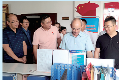
自治区医保中心验收基层医保服务站(点)建设。

价格调控,口腔种植牙全流程调控价格落地执行。去年以来,该盟种植牙医疗服务收费价格(含种植体植入、牙冠修复置入、3D建模、模型打印、导板打印、诊疗、检验化验、影像、麻醉等10项医疗服务费用)在三级、二级、一级定点医疗机构分别不超过3602元、3234元、2916元;种植体收费价格最高不超过1855元,平均降幅55%;牙冠实行挂网采购,最高收费不超过656元。参保群众全流程口腔种植牙费用负担大幅下降。