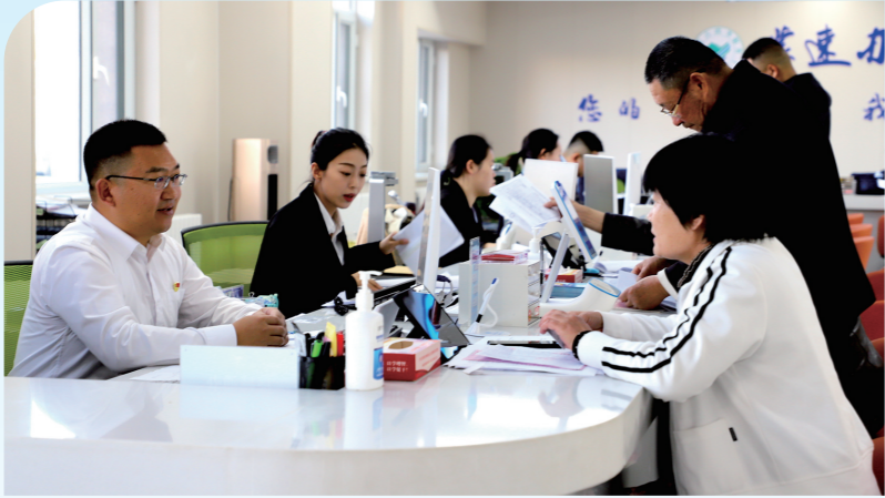
聚焦医保经办服务难点、堵点和痛点,推行“局长走流程”工作制度。