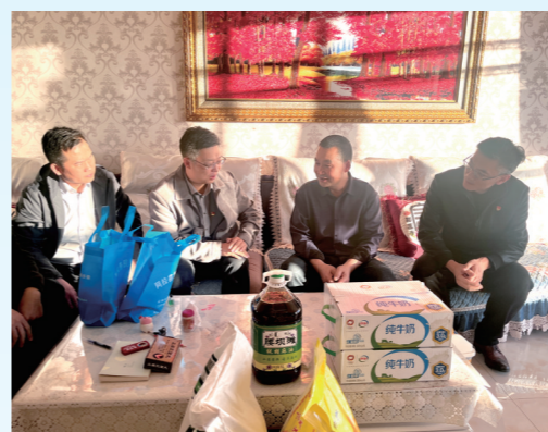
慰问困难家庭,提供医保服务。