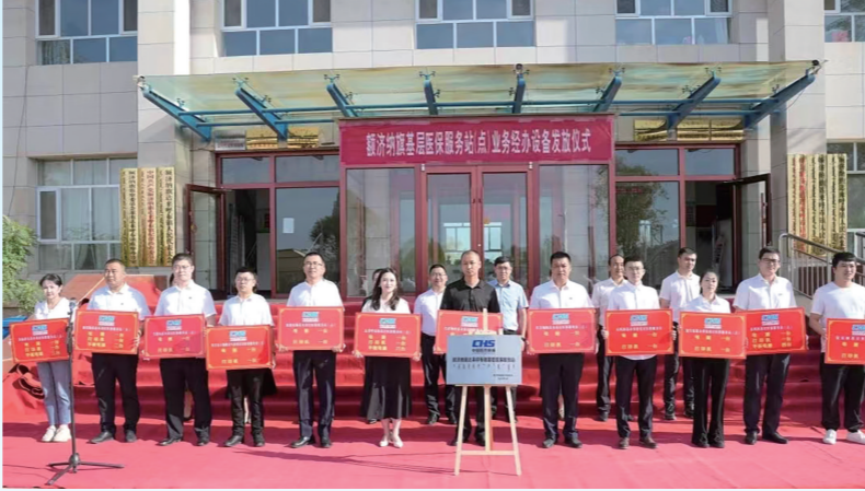
额济纳旗基层医保服务站(点)业务经办设备发放仪式。