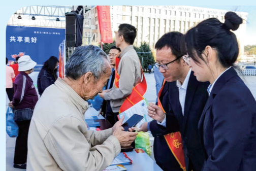
手把手教群众激活电子医保。