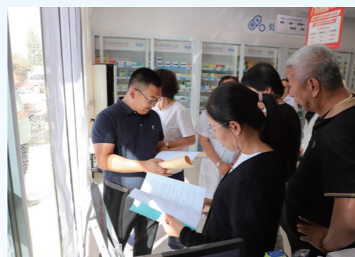
阿拉善盟医保局领导带队检查药店。