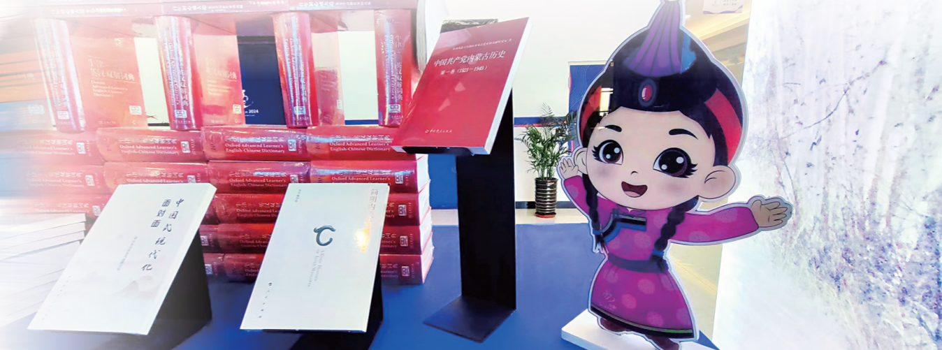
场馆休息区里的新华书店。