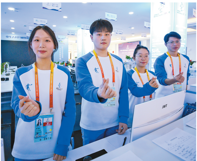
为主体媒体中心服务的志愿者。

办一届简约的冬运会,是时代所需、民心所向。简约不是简单,它需要付出更多努力。“十四冬”的脚步越来越近了,期待一场简约而精彩的冬运盛会。