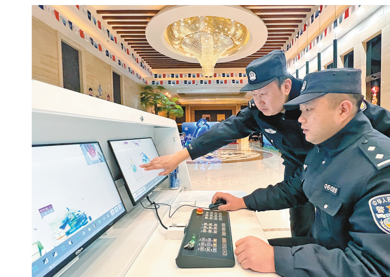
海拉尔赛区“十四冬”媒体接待酒店,执勤民警在认真执勤。