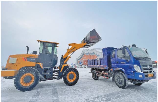
内蒙古自治区冰上运动训练中心工作人员正在进行除雪作业。