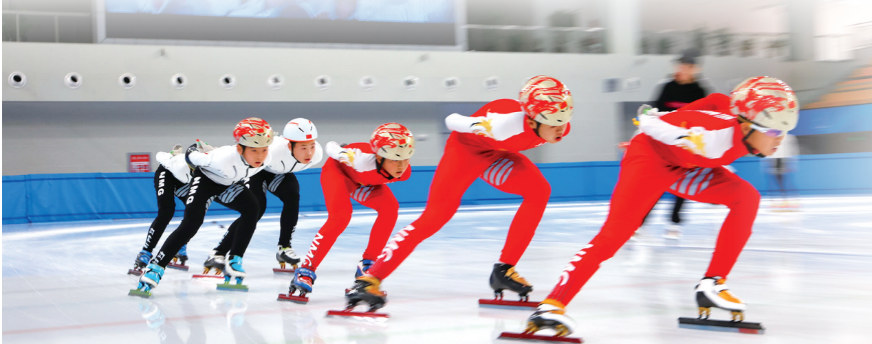
运动员在“十四冬”场馆中训练。