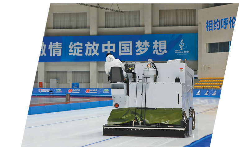
内蒙古自治区冰上运动训练中心短道速滑馆,治冰师在工作中。