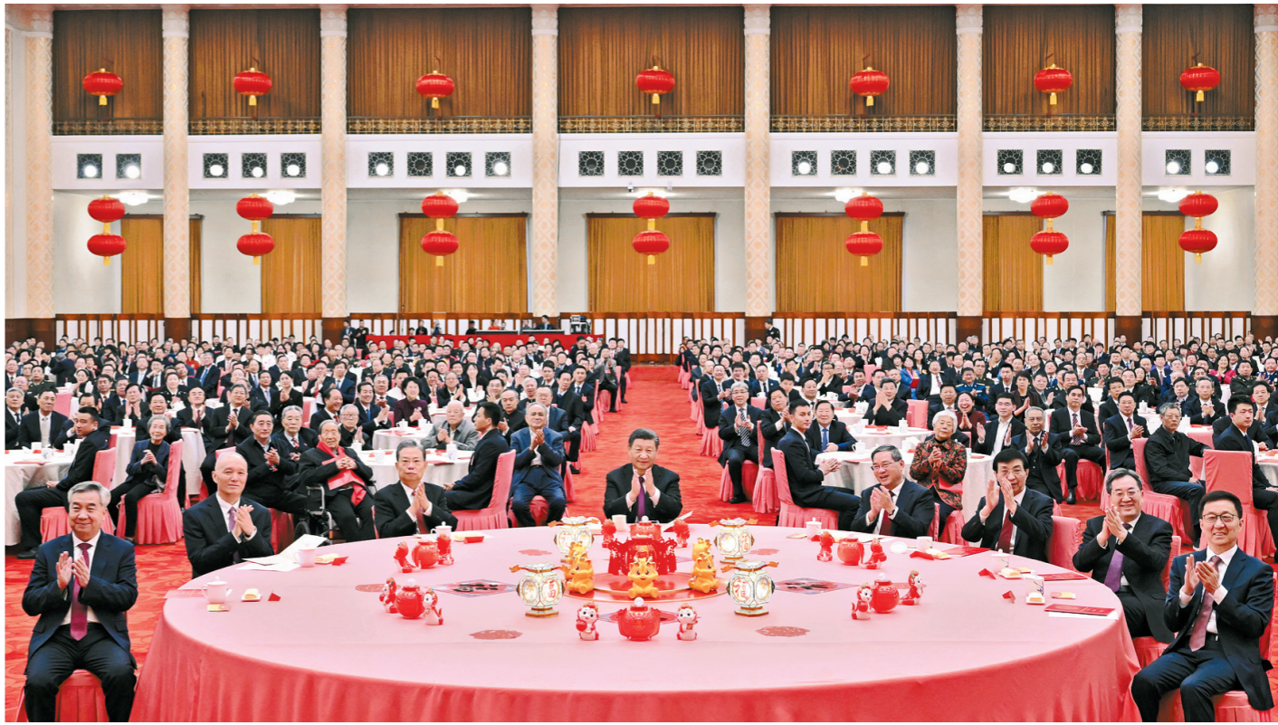
2月8日，中共中央、国务院在北京人民大会堂举行2024年春节团拜会。中共中央总书记、国家主席、中央军委主席习近平发表讲话。