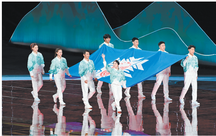
中华人民共和国冬季运动会会旗在开幕式上入场。

熊熊圣火，点燃冰雪激情，照亮奋进之路。奋斗者筑梦北疆的坚实脚步，将从这里开启新的起点。