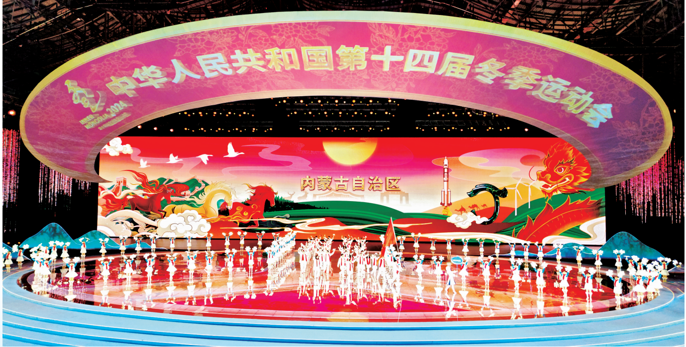
内蒙古自治区体育代表团在开幕式上入场。