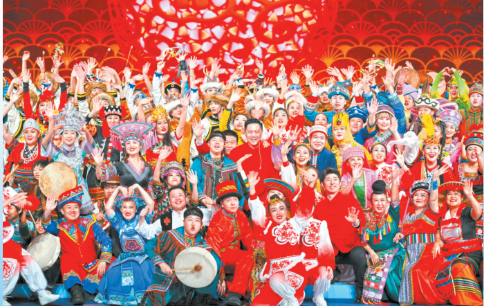
演员在开幕式上表演。

军、短道速滑男子500米世界纪录保持者武大靖手中。两位“数字冰球健儿”与武大靖共同点燃主火炬，“数实交融”的点火方式实现室内外联动，科技感满满。