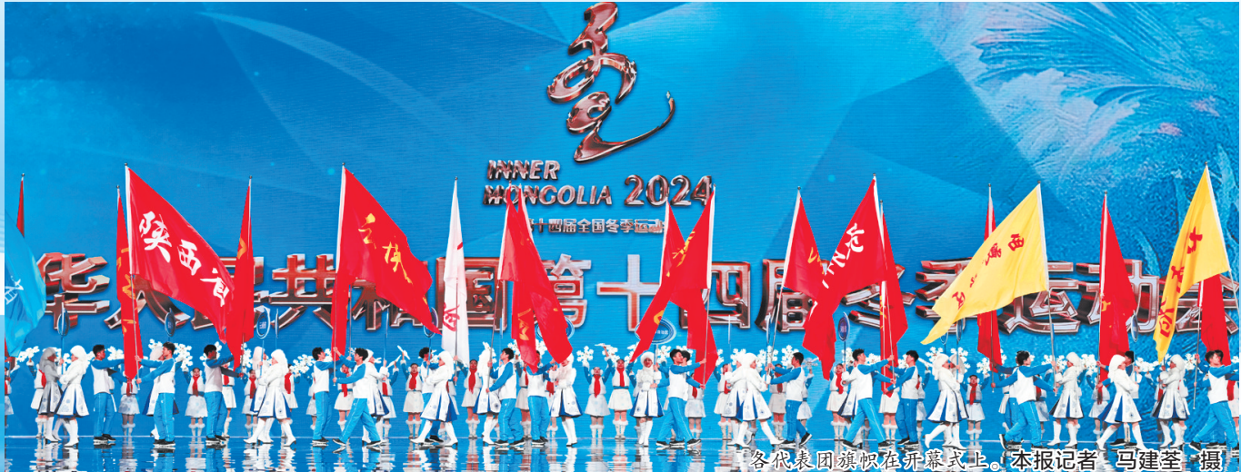
演员在开幕式上表演。