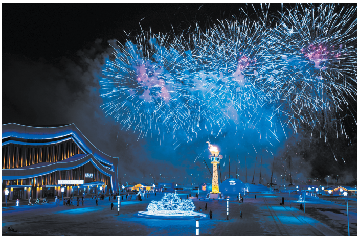
第十四届全国冬季运动会主火炬在开幕式上被点燃。