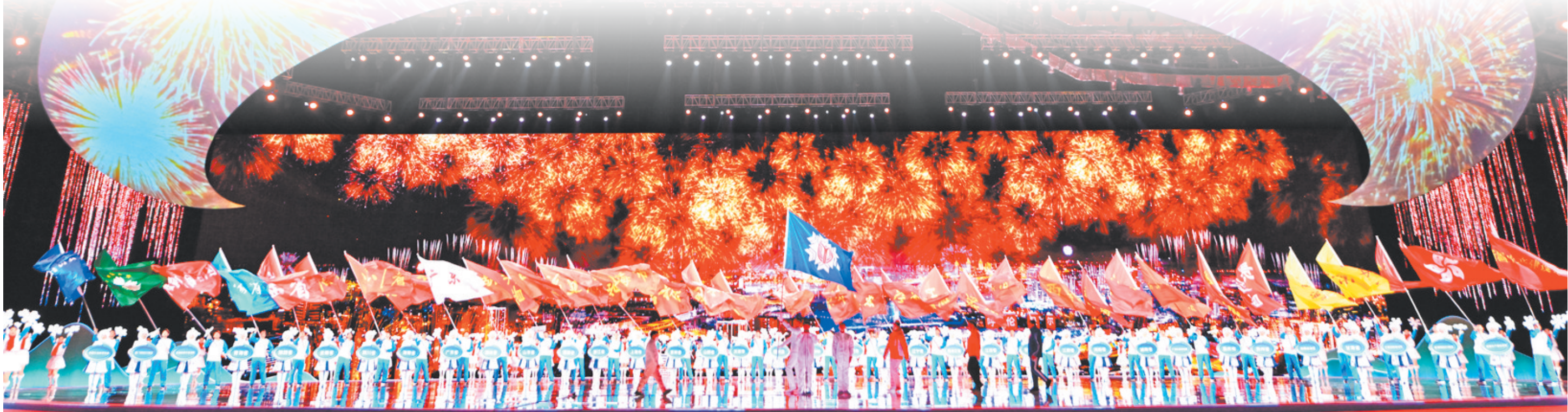
开幕式现场。