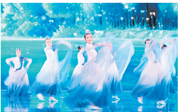
演员在现场表演。