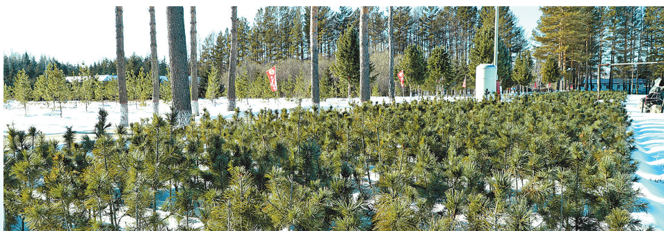
雪中挺立的8年生西伯利亚红松苗木。