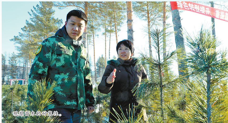
观察苗木的耐寒性。