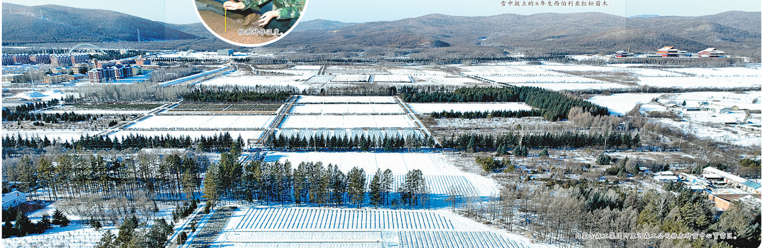
内蒙古森工集团阿里河森工公司林木种苗中心育苗区。

据悉,东、西河沿线各类水闸破冰提闸工作目前全部完成。黑河下游昂茨河、一道河、乌苏木水闸段部分河道已基本平稳开河。阿拉善盟额济纳旗水务部门加强黑河流域重点水闸及重点防凌段巡查,实施24小时防凌值班制度,增加巡护频次,密切关注水情、冰凌变化。