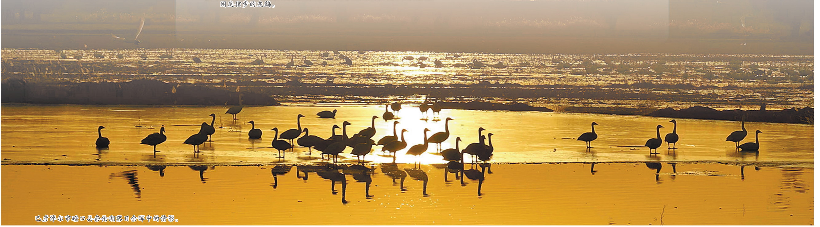
巴彦淖尔市磴口县奈伦湖落日余晖中的倩影。

据悉,乌海黄河流域水污染预警溯源系统可以通过水质指纹比可对快速精准识别污染源,突破了水污染防治和监管领域溯源难、溯源慢的技术瓶颈,同时大幅提升了水环境监管效率和水平。结合精准溯源、现场执法、应急监测,全链条构建起“预警—溯源—应急—执法”联动机制,对违法排污行为形成有效震慑。