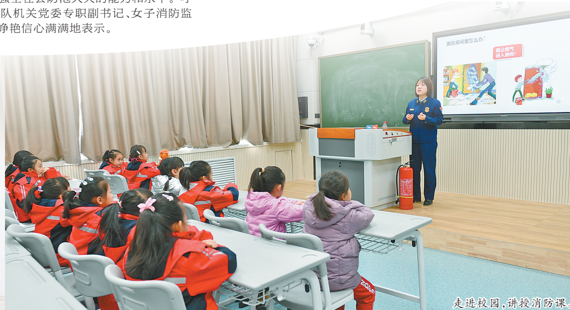
走进校园，讲授消防课。