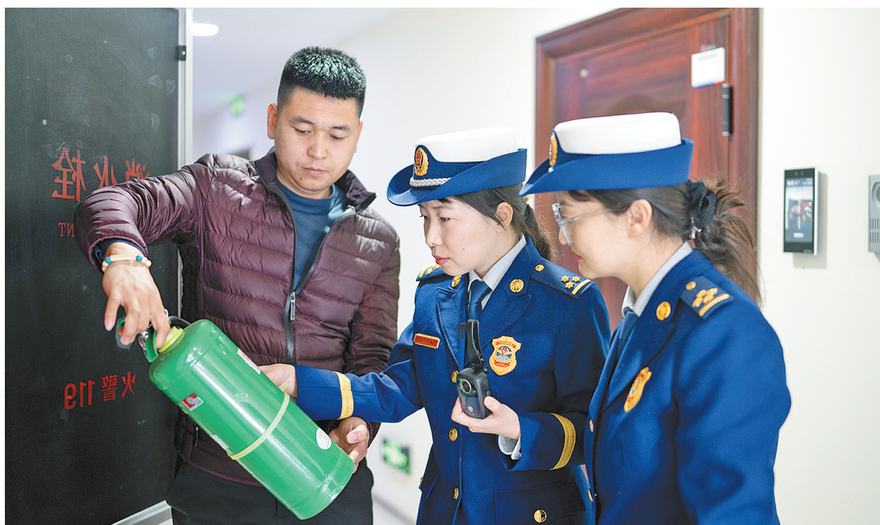
查看灭火器年检标识。

在呼和浩特市，有这样一支“女子先锋队”，她们的足迹遍布企业、学校、医院、机关、社区、农村等，撑起了消防宣传工作的“半边天”。这支队伍的名字叫呼和浩特市消防救援支队女子消防监督服务先锋队，前不久，被全国妇联授予了“全国三八红旗集体”称号。