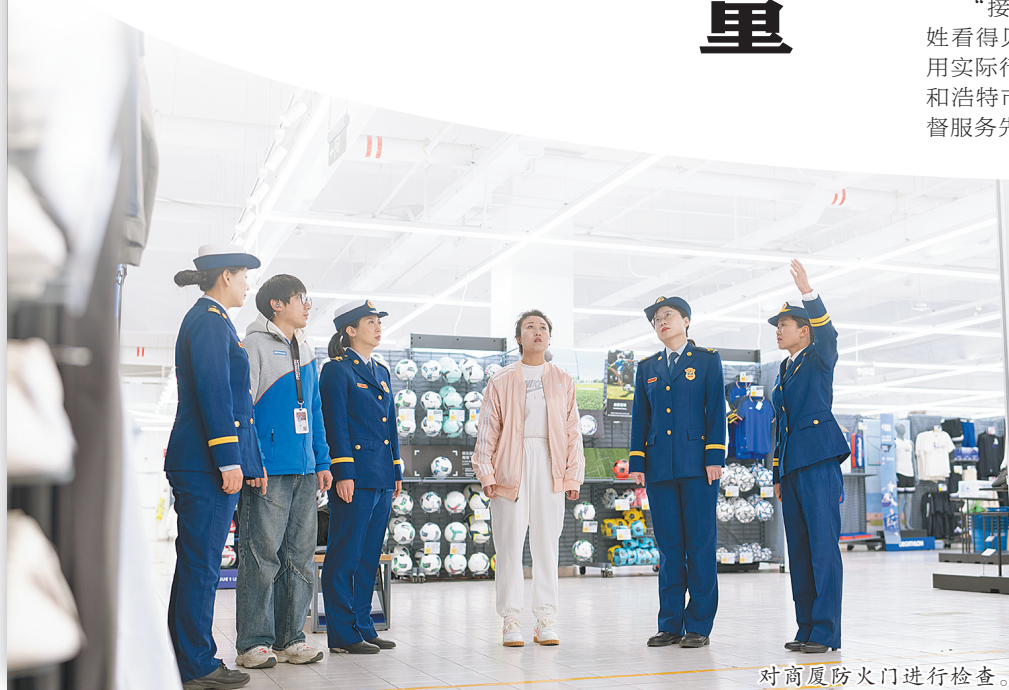
对高层防火门进行检查。