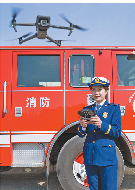
利用无人机查看厂区消防隐患。