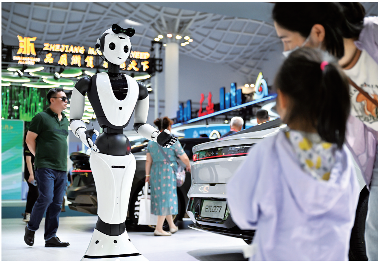
4月15日,第四届消博会湖北展馆的一台AI人形智能服务机器人在与观众互动。

本届消博会探馆过程中,记者发现直播带货成为“香饽饽”。“朋友们,现在进入‘云’逛消博会