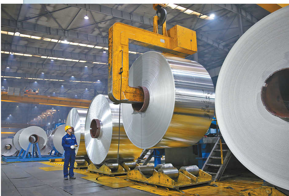
在霍林郭勒高新技术产业开发区内,工人在高端铝箔生产线上作业。