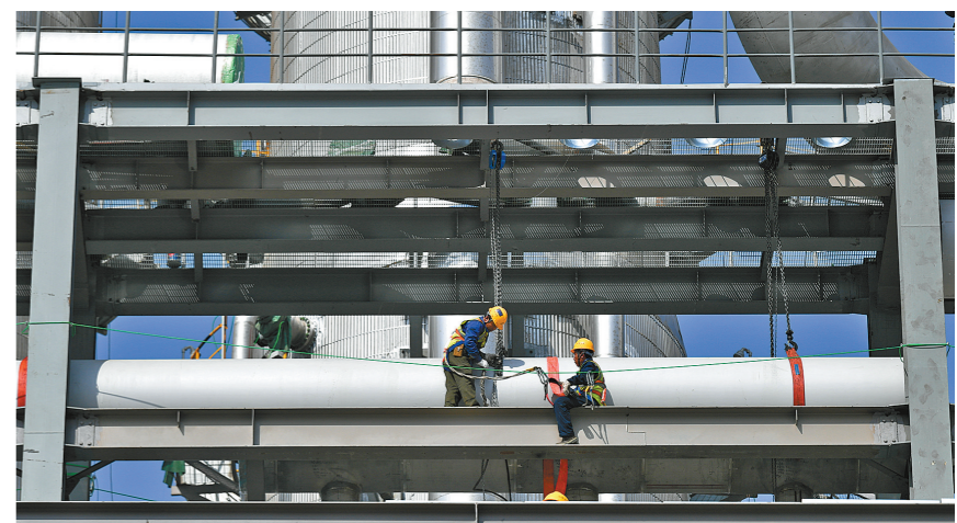
在位于包头市的内蒙古通威硅能源20万吨高纯晶硅项目的施工现场,施工人员正在安装设备。

稳投资、促发展、强信心。北疆大地,一个个大项目、好项目正如雨后春笋,在春天拔节生长,为全年发展注入磅礴动力。