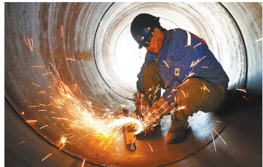
呼伦贝尔东北阜丰生物科技有限公司年产50万吨氨基酸项目施工车间,工人正在进行设备安装。