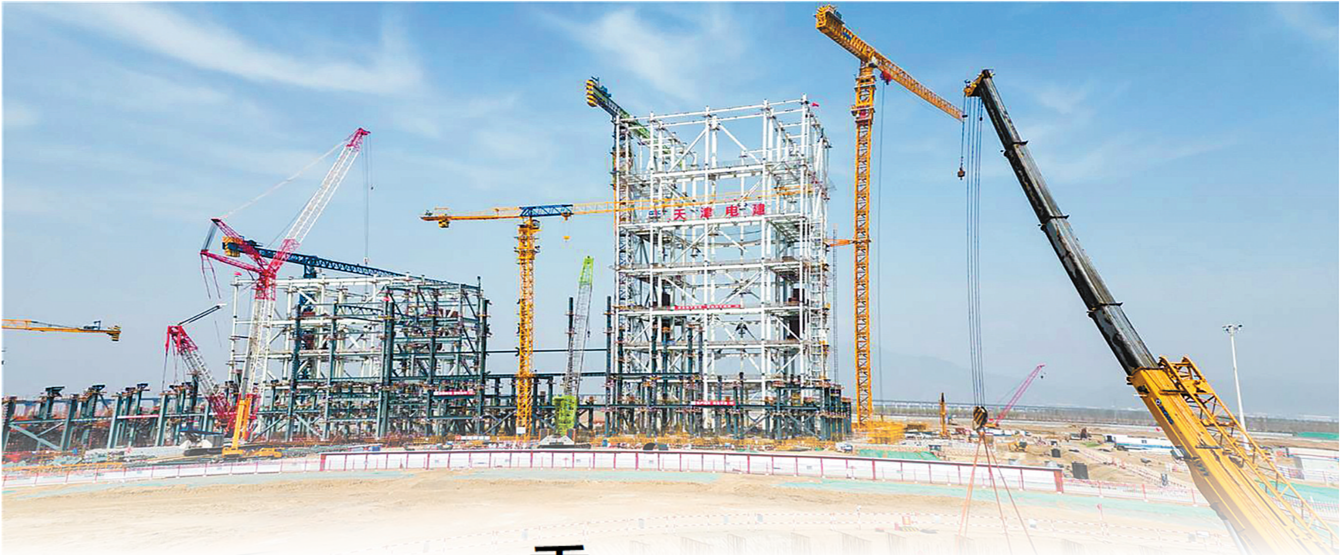
在内蒙古能源集团金山热电厂三期项目施工现场,各类大型机械正在作业。