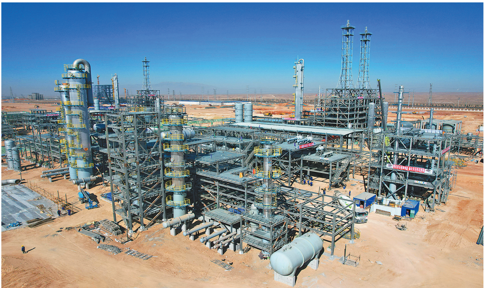
在乌海高新技术产业开发区低碳产业园,乌海市广锦新材料有限公司BDO-PBAT一体化项目建设正酣。