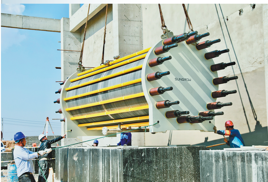
工人在深能北方(鄂托克前旗)公司光伏制氢项目核心部件电解槽吊装施工。该项目是自治区第一批风光制氢一体化项目,一期建设250MW光伏发电和利用绿电年制氢6000吨。