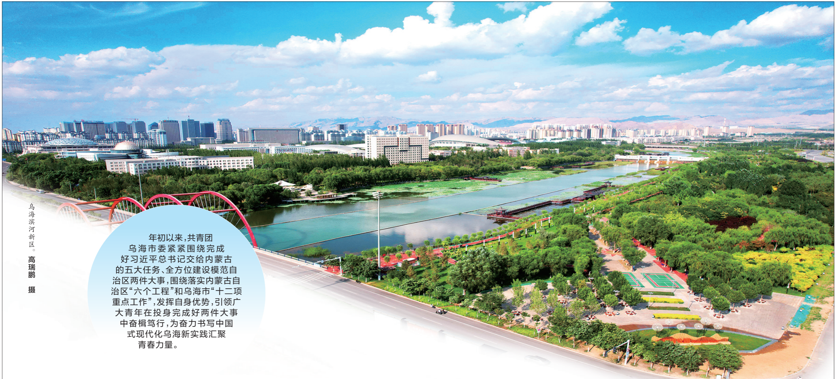
乌海滨河区。

年初以来,共青团乌海市委紧紧围绕完成好习近平总书记交给内蒙古的五大任务、全方位建设模范自治区两件大事,围绕落实内蒙古自治区“六个工程”和乌海市“十二项重点工作”,发挥自身优势,引领广大青年在投身完成好两件大事中奋楫笃行,为奋力书写中国式现代化乌海新实践汇聚青春力量。