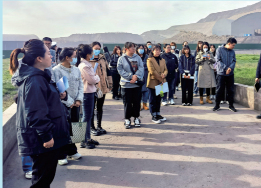
“爱家乡、看成就、促发展”乌海团员青年服务高质量发展学习实践活动。