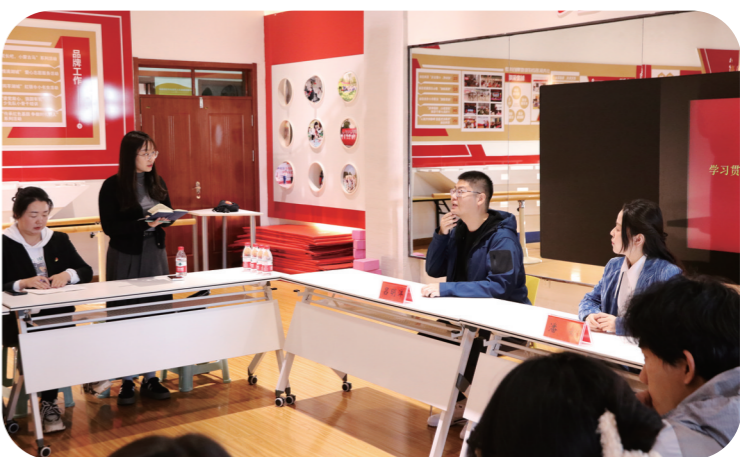
团员和青年学习贯彻习近平新时代中国特色社会主义思想专题读书班交流研讨环节。

奋楫笃行,实干担当。共青团乌海市委将坚决贯彻习近平新时代中国特色社会主义思想,坚决贯彻习近平总书记对共青团的定位和共青团员的期望,紧紧围绕两件大事,胸怀“国之大者”,组织动员全市各族各界青年敢于知重负重、勇于担当作为,扎扎实实干事创业,交出有分量、有质量的青年答卷。