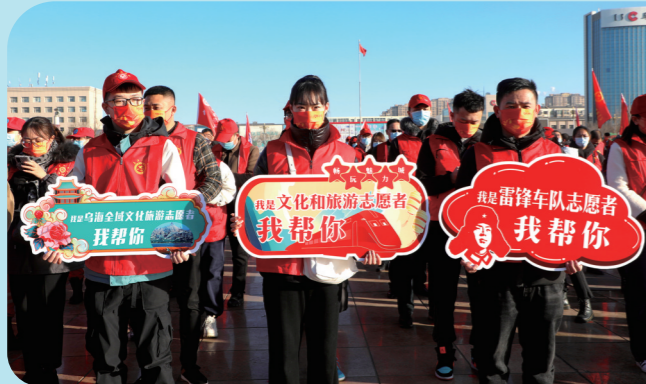
乌海广大青年积极投身志愿服务。