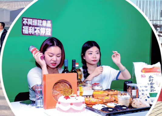
乌海市首届电商主播职业技能竞赛暨“青耘北疆”主播选拔赛。