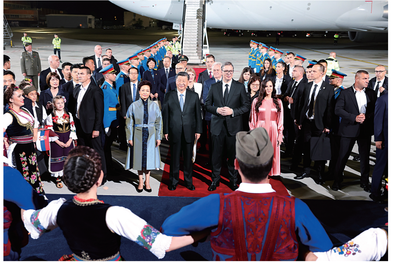
当地时间5月7日晚,国家主席习近平乘专机抵达贝尔格莱德,应塞尔维亚总统武契奇邀请,对塞尔维亚进行国事访问。习近平乘坐专机抵达贝尔格莱德尼古拉·特斯拉国际机场时,塞尔维亚总统武契奇夫妇,对华合作国家委员会主席、前总统尼科利奇夫妇,议长布尔纳比奇,总理武切维奇和外长久里奇等热情迎接。

武契奇表示,中国的投资与合作极大地促进了塞尔维亚的经济社会发展,也提升了塞人民的生活水平。特别是2016年以来,在习近平主席亲自关心和支持下,河钢斯梅戴雷沃钢厂取得巨大经济社会效应,不仅彻底改变了钢厂的命运,也增强了民众的信心和希望。塞尔维亚的未来同中国紧密相连。塞方期待同中方密切各领域、各层级交流,加强在基础设施、新能源、创新、人工智能、人文等各领域的合作。积极推进高质量共建“一带一路”,如期完成匈塞铁路塞尔维亚段建设,欢迎更多中国企业来塞投资合作,期待开通两国更多直航,以塞中自贸协定生效为契机,进一步扩大两国经贸合作。今天我们宣布提升中塞全面战略合作伙伴关系、构建新时代中塞命运共同体,必将成为中塞关系史上新的里程碑。 ■下转第2版