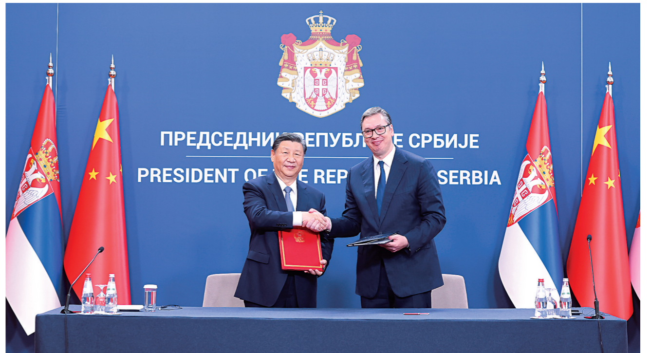
当地时间5月8日上午,国家主席习近平在贝尔格莱德塞尔维亚大厦同塞尔维亚总统武契奇举行会谈。会谈后,两国元首共同签署《关于深化和提升中塞全面战略合作伙伴关系、构建新时代中塞命运共同体的联合声明》。