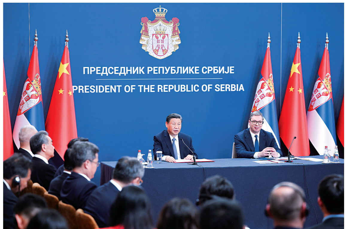
当地时间五月八日中午,国家主席习近平在贝尔格莱德塞尔维亚大厦同塞尔维亚总统武契奇共同会见记者。

——我们共同宣布构建新时代中塞命运共同体,开启中塞关系历史新篇章。 ■下转第4版