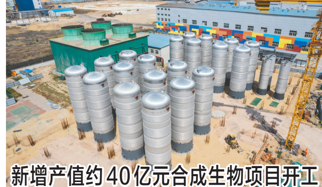
新增产值约40亿元合成生物项目开工