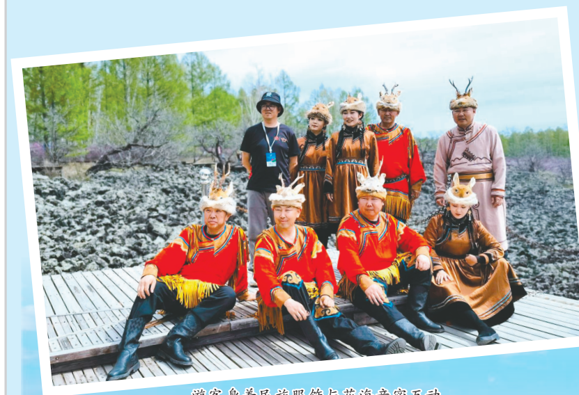
游客身着民族服饰与花海亲密互动。

五月的内蒙古大兴安岭,万木吐绿,杜鹃飘香,“赏万顷杜鹃,游浩瀚林海”的壮丽画面在这里上演,走进毕拉河达斡尔滨国家森林公园,共赴一场万顷杜鹃花海的视觉盛宴。5月8日,内蒙古大兴安岭2024年杜鹃花季暨越野穿越正式启动,景区内游人如织,游客在亲近自然、与花共舞、饱览美景的同时领略民俗风情,尽情享受内蒙古大兴安岭春日的美好时光。