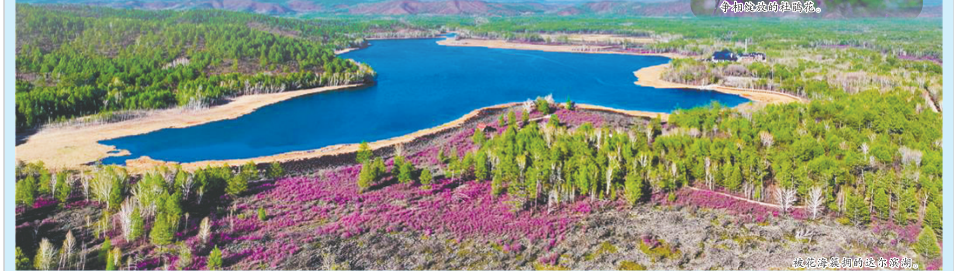
被花海簇拥的达尔滨湖。