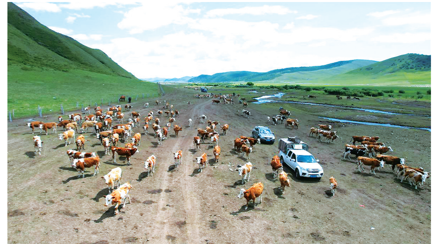
连日来,通辽市扎鲁特旗格日朝鲁苏木牧民们陆续开始走“敖特尔”,向水草丰茂的夏季牧场转场。

扎鲁特旗格日朝鲁苏木约有280万亩山地草原,是我国北方重要生态安全屏障的重要组成部分。每年6月至10