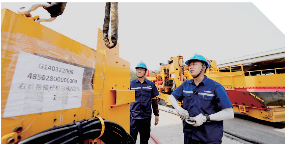
检修人员正在寻找最佳吊点。

神东煤炭集团胸怀“两个大局”、牢记“国之大者”,坚决扛起迎峰度夏能源保供“主力军”的责任担当,保证煤矿应产尽产,13座矿井11个选煤厂闻令而动,以必胜的信心和决心打好打赢这场攻坚战。