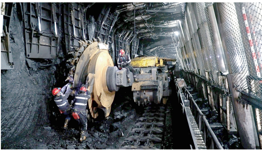
检修突击队正在检修。