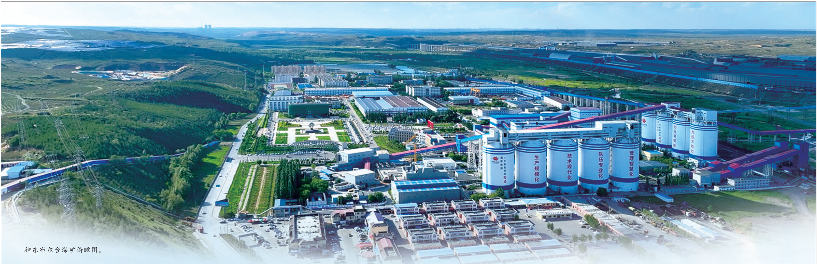
神东布尔台煤矿俯瞰图。