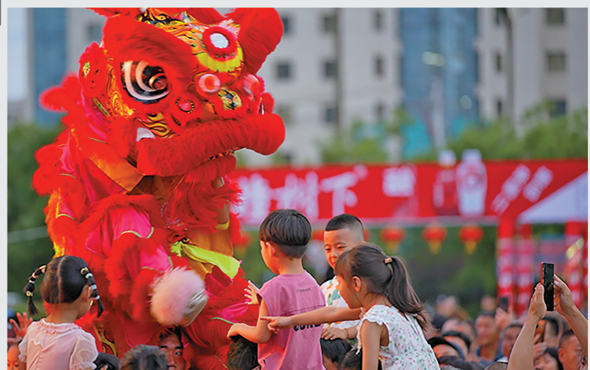
在赤峰市松山区第二届松山之夜美食节上,孩子们与舞狮队进行互动。

近年来,内蒙古在积极打造自治区级夜间文化和旅游消费集聚区,出台政策支持夜间经济发展等方面持续发力。独具特色的“夜经济”正在点亮内蒙古新“夜”态,为内蒙古经济持续健康发展增光添彩。