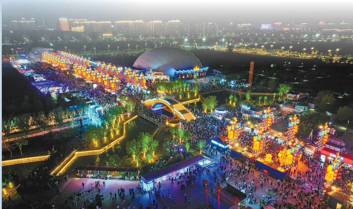
“乌兰察布之夜”旅游休闲街区流光溢彩。该街区是乌兰察布市首座以精致国潮文化为主线,汇集古风古韵、现代文化、智能夜游、衍生文创、景观打卡等诸多元素的网红打卡地。