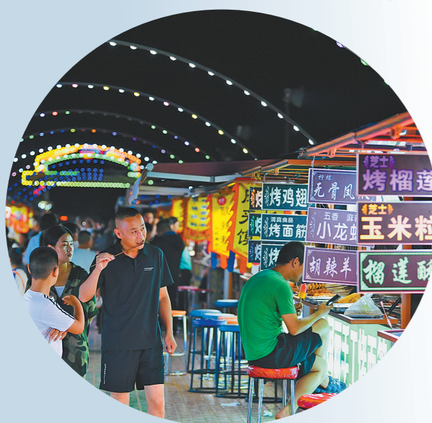
盛夏时节,游客在鄂尔多斯市鄂托克前旗小吃街品尝美食。