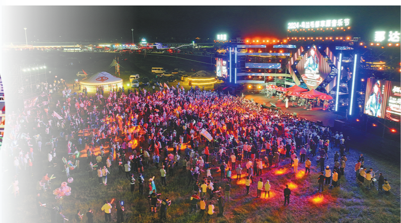
来自全国各地的游客相聚在2024·乌兰毛都草原音乐节上,尽享音乐盛宴。7月17日至8月18日,兴安盟乌兰毛都草原开启持续一个月的音乐狂欢,让游客们沉浸式领略草原与音乐碰撞的独特魅力。