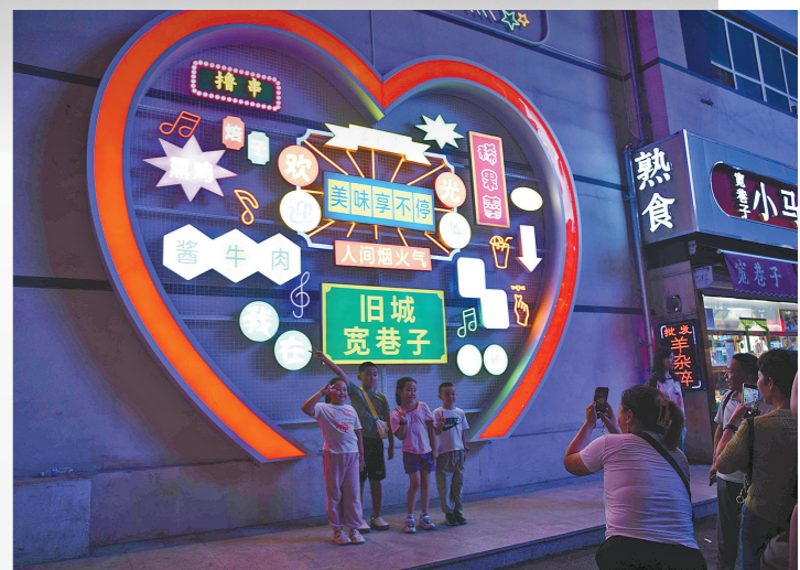
华灯初上,游客在呼和浩特市百年老街宽巷子拍照打卡。

在凉爽夜风中畅快骑行,去人流如织的夜市吃一顿烧烤、约上三五好友在夏夜看一场演出……酷暑之下,避开白天的高温烈日,清凉的夏日夜游成为文旅市场新宠,越来越多的夏日避暑新方式被解锁,层出不穷的夜游创新玩法在内蒙古各地精彩亮相。