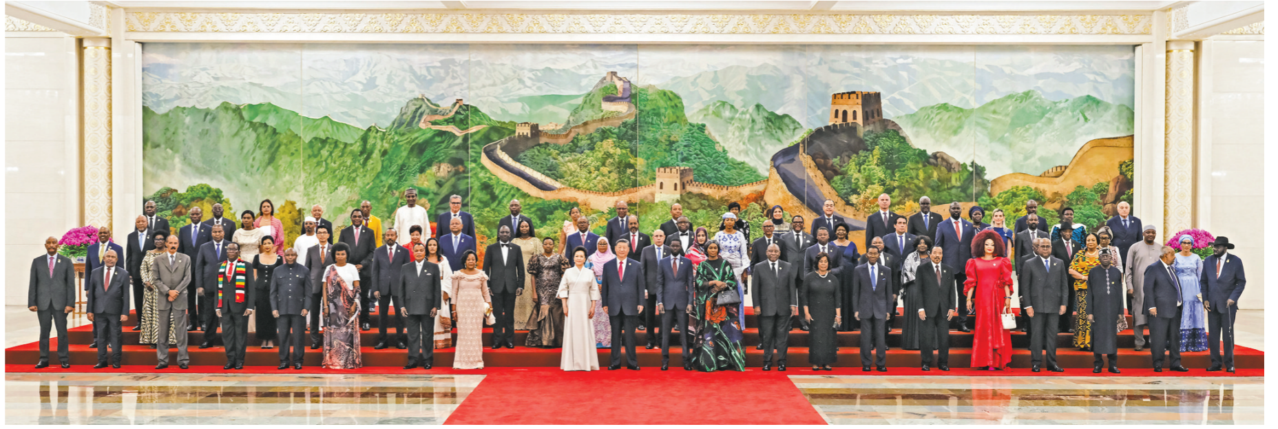
9月4日晚,国家主席习近平和夫人彭丽媛在北京人民大会堂举行宴会,欢迎来华出席中非合作论坛北京峰会的非方及国际贵宾。这是宴会前,习近平和彭丽媛同贵宾们集体合影留念。