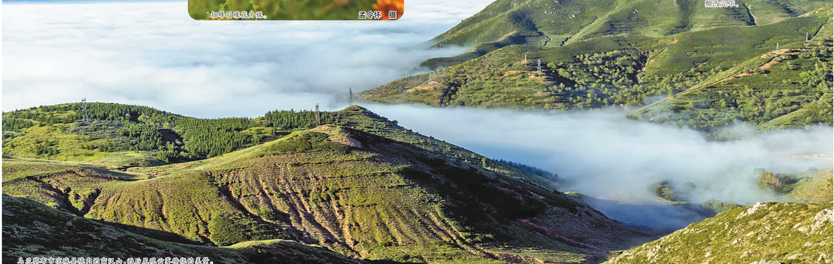
乌兰察布市凉城县境内的蛮汉山,雨后呈现云雾缭绕的美景。

据悉,赤峰市生态环境局认真落实“三线一单”分区管控要求,依法依规做好矿山项目环评审批。同时,印发《赤峰市入河排污口“一口一策”整治实施方案》,排查出10家矿山企业入河排污口15个,目前已规范整治12个,依法取缔3个。此外,赤峰市还实施开展尾矿库再排查再整治专项行动,排查发现19座尾矿库存在26个污染隐患,目前已全部整改完毕。