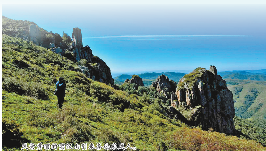
风景秀丽的蛮汉山引来各地游人。