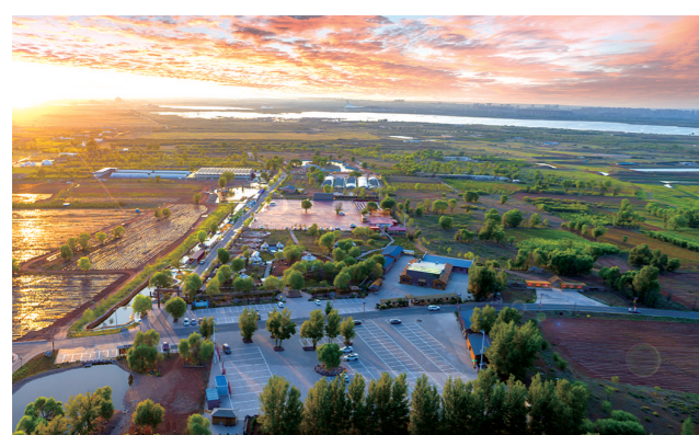
美丽乡村哈沙图村。