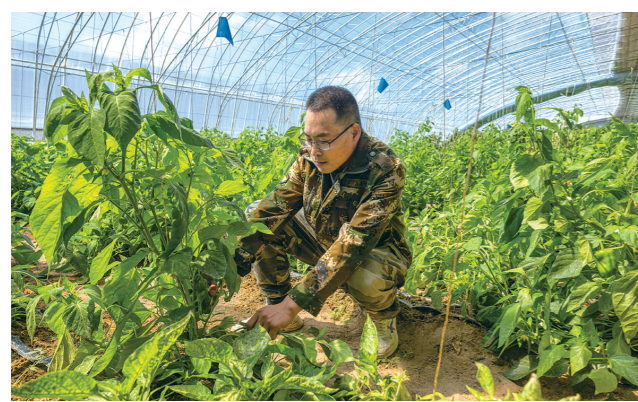
村民正在查干苏村昌茂绿怡生态农场内摘菜。