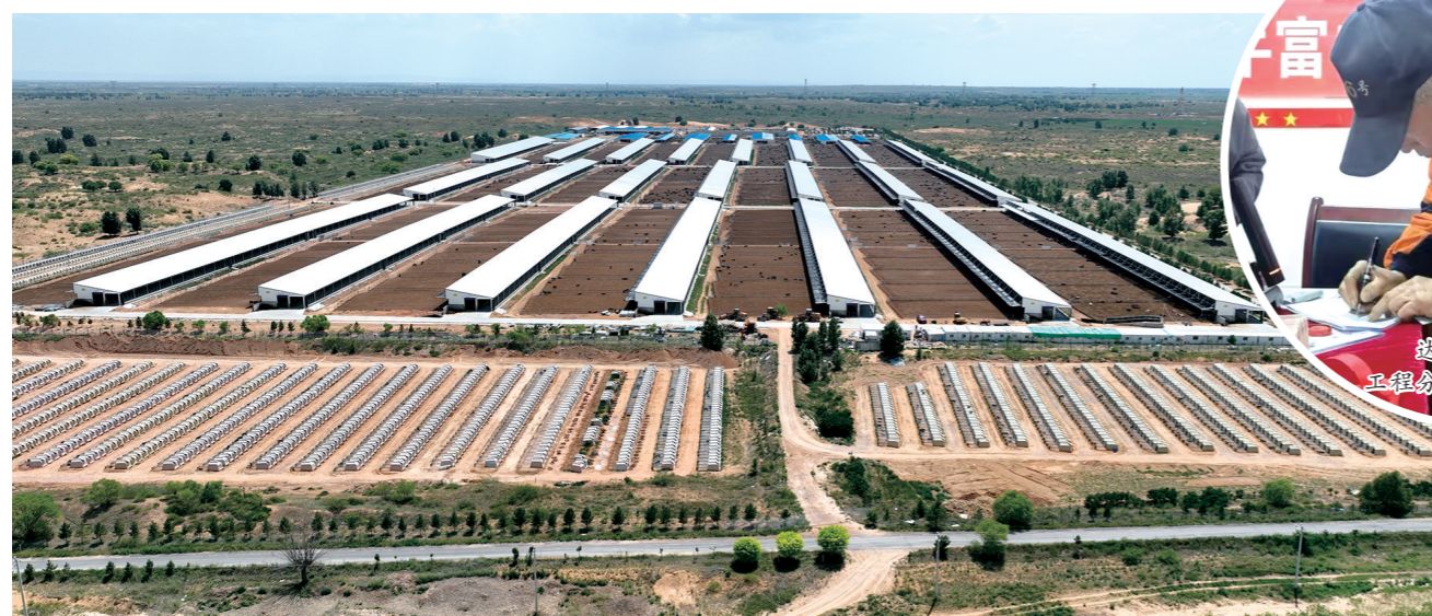
乌审旗肉牛现代农牧业产业园。

蓄势待发正当时。鄂尔多斯市的这头牛,走到了乡村振兴“C位”,走出了共同富裕的好前景,唱响了“牛业奔腾”的“新牧歌”。