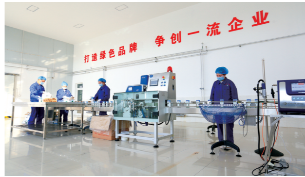
鄂尔多斯市乌澜乳业有限责任公司生产牛奶外包装车间的工人正在包装牛奶。

一头头乡村振兴的“社牛”,成为了强农富农的首位产业、畜牧业经济发展的优势产业,“犇”出了鄂尔多斯市全产业链发展新格局。