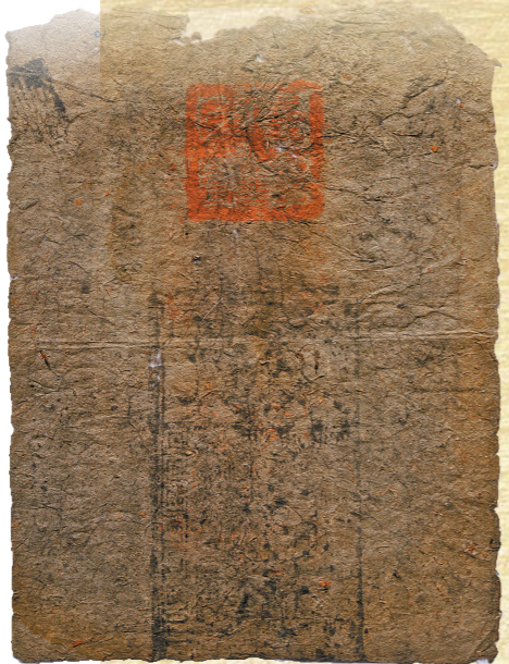
“至元通行宝钞贰贯”纸钞

钱图案。 下面是花栏,栏中有铜 自右到左横写「贰贯」, 「印造宝钞库印」红印章, 背面盖有八思巴文