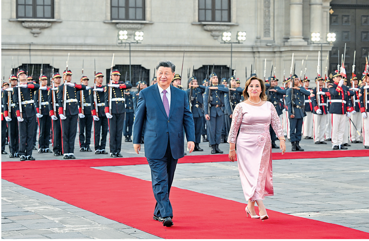
当地时间11月14日下午,国家主席习近平在利马总统府同秘鲁总统博鲁阿尔特举行会谈。博鲁阿尔特在总统府前广场为习近平举行隆重盛大欢迎仪式。