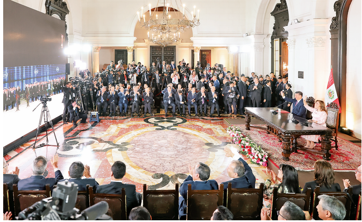
当地时间11月14日晚,国家主席习近平同秘鲁总统博鲁阿尔特在利马总统府以视频方式共同出席钱凯港开港仪式。