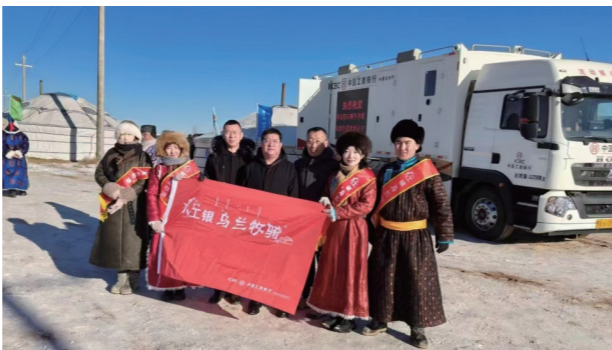
工银“乌兰牧骑”活动。

打造工银“乌兰牧骑”金融直通车流动服务场景。将柜面、授权等系统功能集成于银行车内,发挥其机动性强、服务能力强的特点,借助工银“乌兰牧骑”活动,进一步延伸服务触角,拓宽服务渠道,深入乡镇、苏木,将优质金融服务送入千家万户、送进田间地头,为广大边远地区客户提供结算、理财、金融知识普及等上门服务,以科技助力,彰显大行担当。全区76支工银“乌兰牧骑”小分队累计服务3.5万余人次,惠及群众超30万人次,先后荣获《人民日报》“新时代企业党建”优秀案例、人民网“第十九届人民匠心奖”、中国企业文化研究会“新时代十年企业文化”典型案例等多项国家级荣誉。