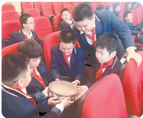
学生们现场赏析陶器。

“文博知识进校园突出了学习的趣味性、互动性与体验性，太有意思了。”近日，来自呼和浩特市香路小学的学生感慨道。