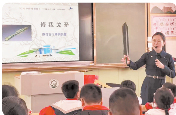
讲解员向学生们介绍青铜兵器。

自9月起，内蒙古博物院开展2024年秋冬学期“行走中的博物馆——中国古代文明”系列课程，该院金牌讲解员们带着珍贵的文物，走进呼和浩特市多所学校，开设“中国古代文明系列”13门课程，从中国古代科学、技术、礼仪、文化、艺术等多个视角引导青少年深入了解北疆文化、感悟中华文明。截至11月27日，内蒙古博物