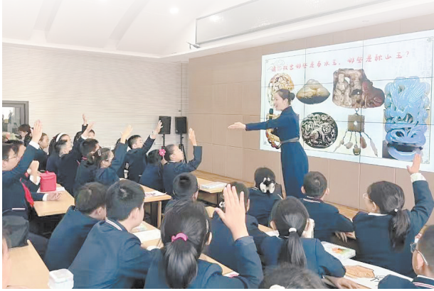
学生们在课堂上踊跃发言。