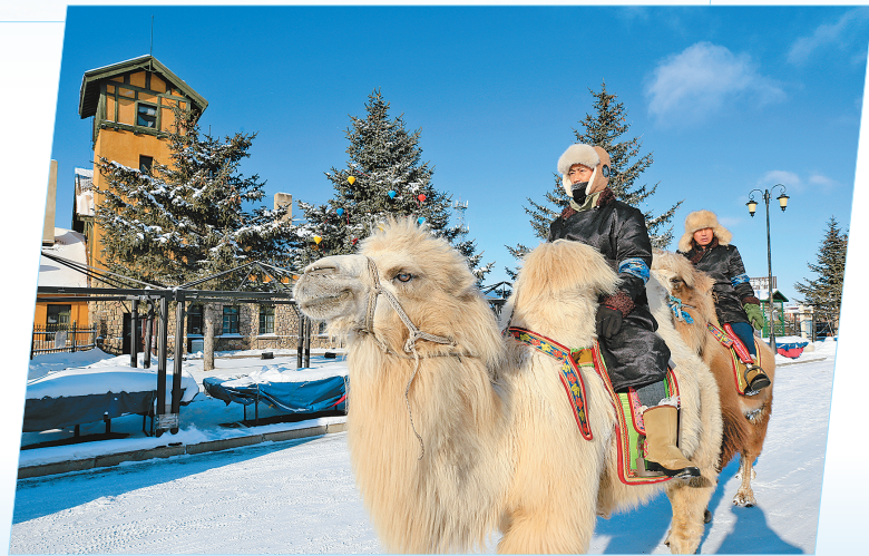
游客感受原生态民俗。