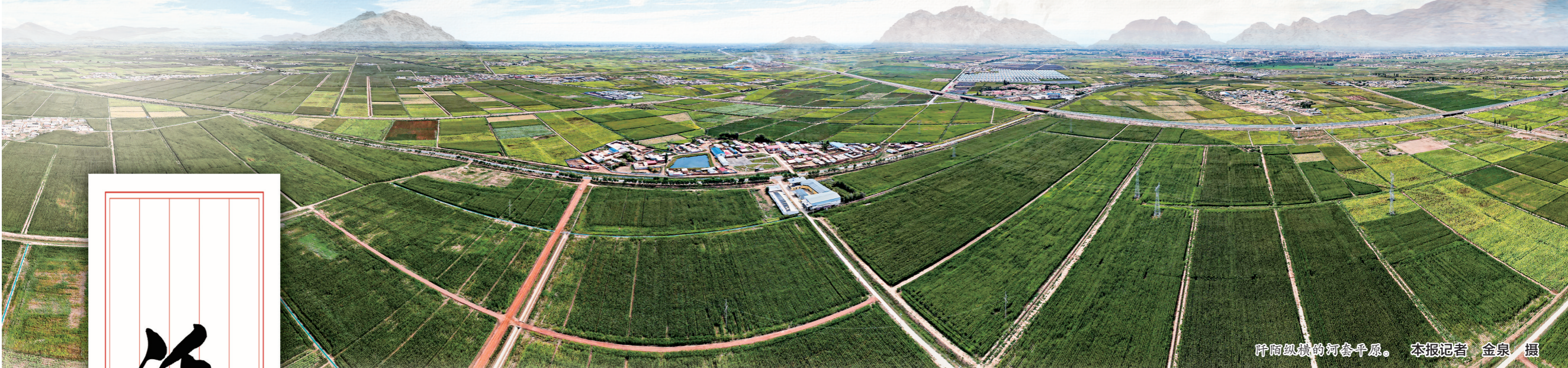
阡陌纵横的河套平原。

伴随着农业的开拓、发展，河套地区的农耕文化以其独特的文化价值和人文精神，向世界展示着河套文化的无穷魅力与时代风采。