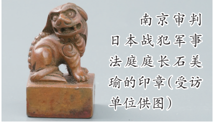
南京审判日本战犯军事法庭庭长石美瑜的印章

“根据《东京日日新闻》报道,两名日本军官比赛看谁能先杀死100名中国士兵,结果都杀了超过100人,双方打平杀了106人,他们又同意重新比赛杀到150人为止,12月6日是89比78,12月1日是56比26。”这是1937年12月14日发行的《芝加哥每日论坛》中,一篇有关两名日本军官进行“百人斩”杀人竞赛的报道节选。 在1937年12月6日发行的《纽约时报》中,也登载了有关日军“百人斩”杀人竞赛的报道。报道称,来自上海前线的一份电报详细介绍了两名日本军官之间的一场比赛,看谁先杀死100名中国人。年纪分别为25岁和26岁的日本军官把赌注压在了这项“成就”上。 这两份报纸由美籍华人鲁照宁捐赠。“百人斩”杀人竞赛是日军残酷暴行的典型案例。这种罪恶行径不仅是杀死中国人,更是以虐杀为乐,充分暴露侵略者的本质。江苏省行政学院教授杨夏鸣认为,西方媒体的相关报道,具有重要的史料、文物和展陈价值。 (据新华社报道)