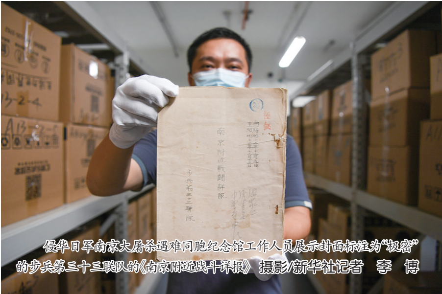
侵华日军南京大屠杀遇难同胞纪念馆工作人员展示封面标注为“极密”的步兵第三十三联队的《南京附近战斗详报》