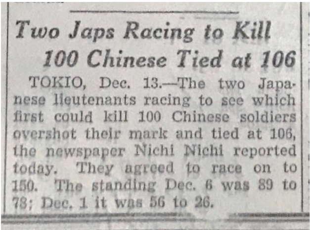
1937年12月14日刊发的《芝加哥每日论坛》(节选)

今年12月13日是第十个国家公祭日。侵华日军南京大屠杀遇难同胞纪念馆各类藏品总量已达19.3万件(套)。 自2014年设立首个国家公祭日以来,纪念馆新增860件(套)文物,其中一级文物63件(套)、二级文物204件(套)、三级文物593件(套)。文物无言,历史有声。记者从新增文物中选取4件,还原历史真相,警醒国人勿忘国耻。