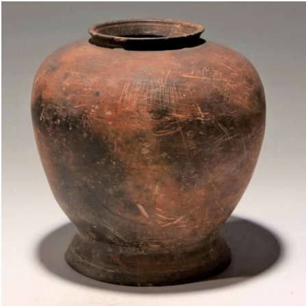
刻符黑陶罐(浙江余杭南湖采集) 尺寸:高26.4 口径12.8 腹径25 底径19(单位:厘米) 收藏单位:良渚博物院(良渚研究院)