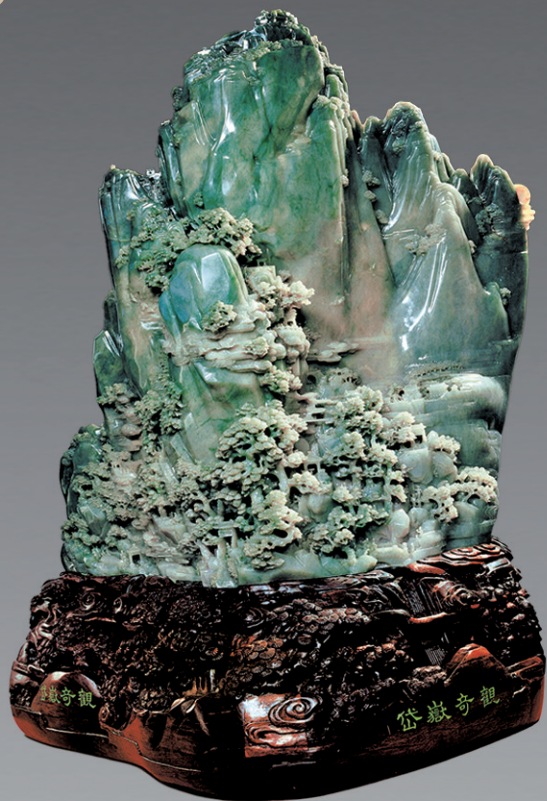
翡翠山子《岱岳奇观》