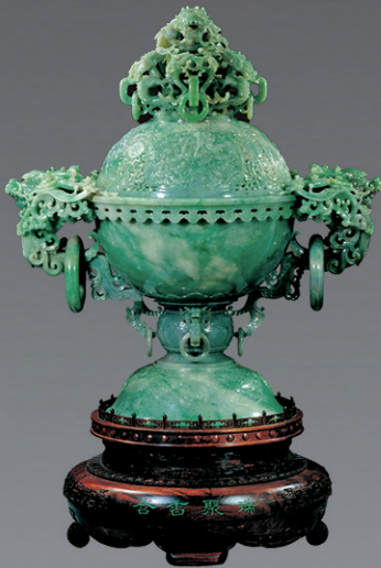
翡翠花薰《含香聚瑞》