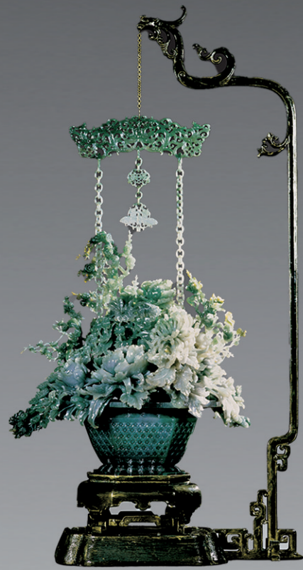
翡翠提梁花篮《群芳揽胜》