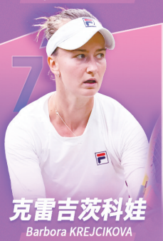
克雷吉茨科娃 Barbora KREJČIKOVA