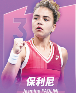
保利尼 Jasmine PAOLINI