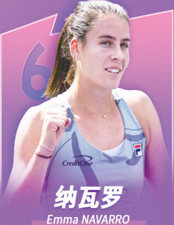
纳瓦罗 Emma NAVARRO