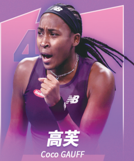
高芙 Coco GAUFF