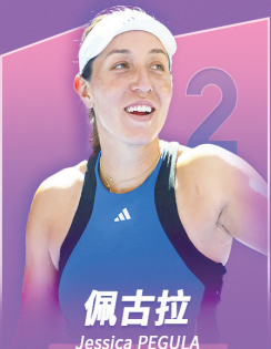
佩古拉 Jessica PEGULA