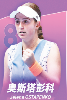
奥斯塔彭科 Jelena OSTAPENKO