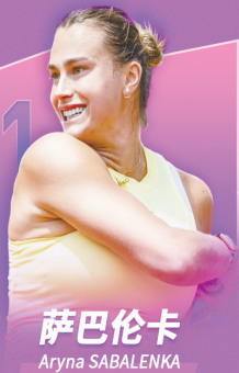
萨巴伦卡 Aryna SABALENKA