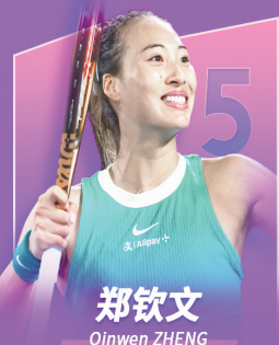
郑钦文 Qinwen ZHENG