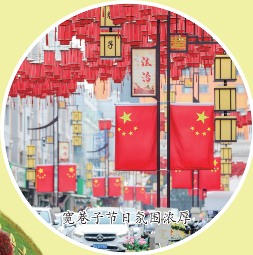
宽巷子节日氛围浓厚