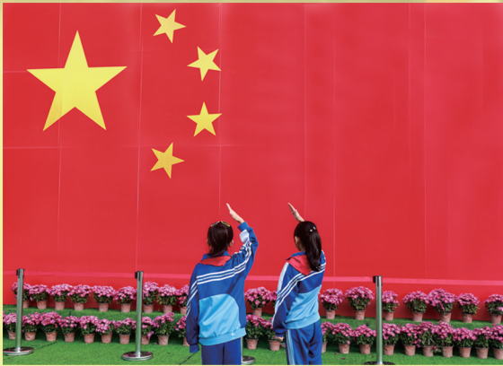
少先队员向国旗敬礼