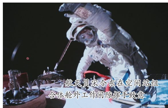
航天员宋令东在空间站组合体舱外工作间隙挥手致意

哲、宋令东圆满完成任务,实现了新的突破,我为你们的精彩表现感到骄傲,我们天地同心瞰寰宇,携手共创新未来。祝大家今晚做个好梦!