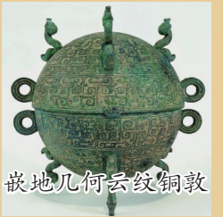
嵌地几何云纹铜敦