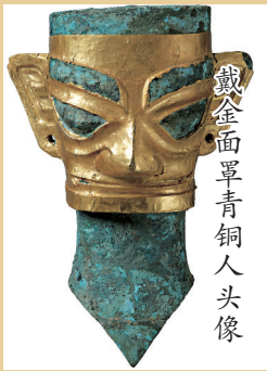
戴金面罩青铜人头像