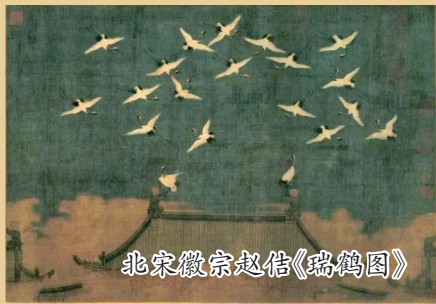
北宋徽宗赵佶《瑞鹤图》