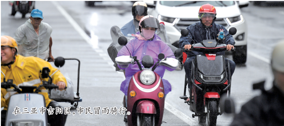
在三亚市吉阳区,市民冒雨骑行。

此外,教育部国家大学生就业服务平台持续推出系列“互联网+就业指导”公益直播课,加强毕业生就业指导和服务。(王鹏)