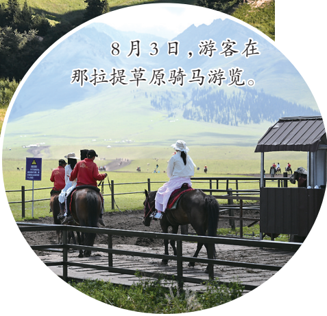
8月3日,游客在那拉提草原骑马游览。