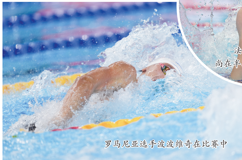
罗马尼亚选手波波维奇在比赛中