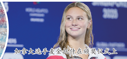
加拿大选手麦金托什在颁奖仪式上