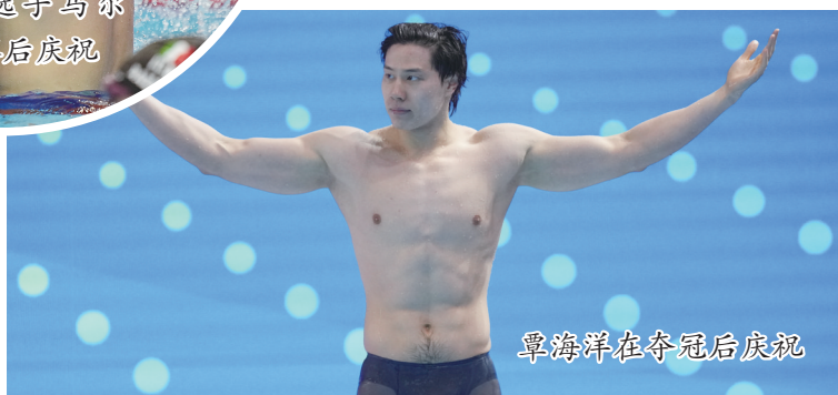
覃海洋在夺冠后庆祝