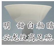
明 甜白釉暗 云龙纹高足碗