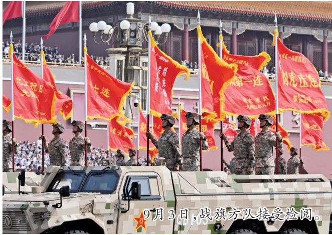
9月3日,战旗方队接受检阅。

因为当时的书写习惯,旗帜上的“庄”字就多了一点。2000年颁布的《中华人民共和国国家通用语言文字法》规定异体字为非规范汉字。同时,该规定也指出允许使用的六种场合,其中包括:经国务院有关部门批准的特殊情况。阅兵仪式上使用的“庄”字就属于允许使