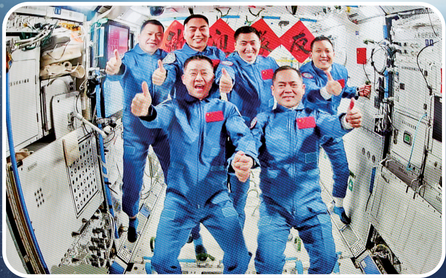
这是11月1日在北京航天飞行控制中心飞控大厅拍摄的神舟二十号航天员乘组和神舟二十一号航天员乘组会师后拍摄“全家福”照片的实时画面。

作为中国航天的“母港”，内蒙古境内有一个发射场——东风航天城发射场，两个航天器着陆场——四子王旗着陆场和额济纳着陆场。几十年间，内蒙古见证和托举了中国所有21艘神舟飞船的起飞、降落，也全力以赴服务了“东方红一号”、嫦娥探月器等重大任务。