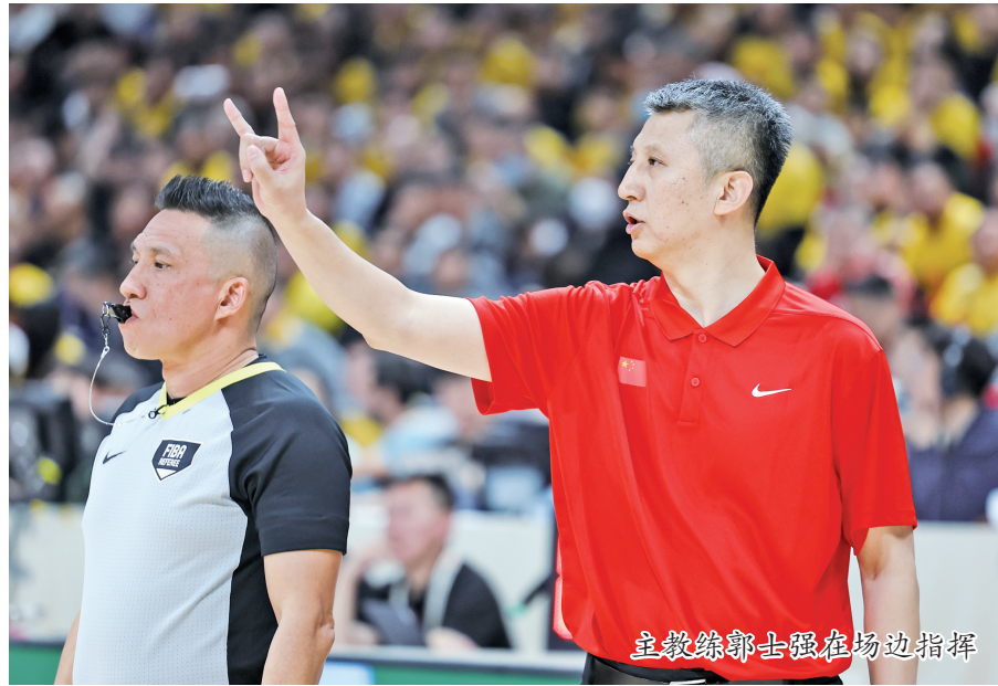
主教练郭士强在场边指挥

因,那么进攻端的全面哑火则让中国男篮吞下“开门黑”苦果。全场比赛,中国男篮命中率仅为38.8%,三分球更是26投仅6中,全队投中的三分球还没有李贤重一人多。核心球员的状态低迷是进攻不畅的主要原因。胡明轩再次陷入“首战迷失”的怪圈,仅靠罚球得到2分。此外,中国队在进攻端缺乏稳定、高效的终结点,导致内外线失联,战术体系运转失灵。