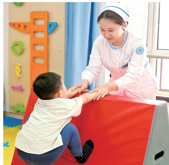
护士指导儿童开展康复训练

深耕科研多年,任海燕入选国家“万人计划”、国家林草局林草科技创新领军人才,荣获内蒙古自治区青年创新人才奖、全国三八红旗手等荣誉和奖项。面对荣誉,她依然保持着科研工作者的朴实与热忱:“希望将基础理论转化为实用技术,真正为草原生态、生产发展、百姓生活,贡献自己的一份力量。”