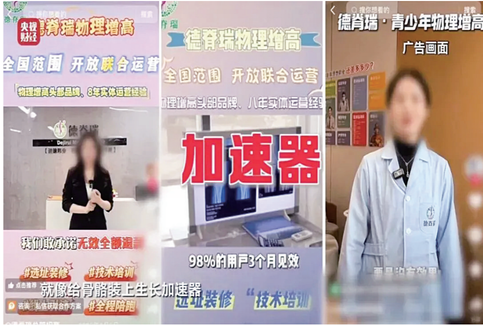
增高机构宣传语(视频截图)

直播平台上,一些电商主播们卖力介绍他们对外租赁电动自行车,公然违反国家管理规定,大肆宣传其产品超越国家标准,速度超快。记者在一家电动车租赁店里租到的车辆,实测速度竟高达80公里/小时。