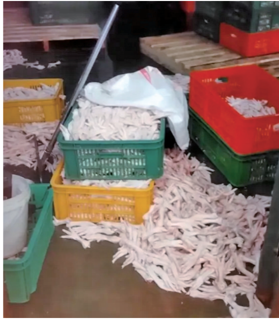
鸡爪加工车间(视频截图)

当记者追问增高方案的科学依据与医学支撑时,负责人表示,他没有医学数据或临床验证报告,他只想挣钱。