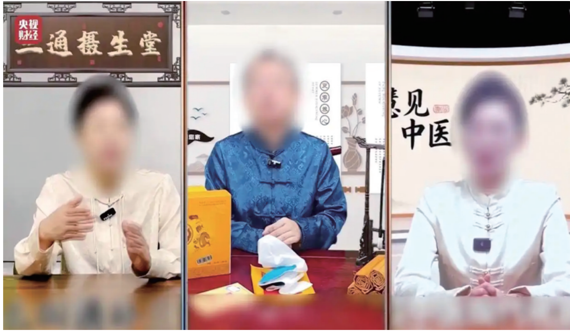
抗骗老年人的“私域营销”(视频截图)

3月15日,央视第36届“3·15”晚会播出,聚焦“放心消费 品质生活”主题,关注食品安全、公共安全、金融安全、广告市场等领域侵害消费者权益的违法行为。当晚,市场监管总局启动应急处置机制,部署开展执法行动,全力维护消费者合法权益,查处情况将及时向社会公布。天津、沈阳、重庆、成都、温州、杭州、上海等地也连夜发布情况通报,对相关涉事企业进行查处。