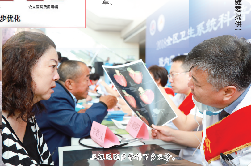
三级医院多学科下乡义诊。