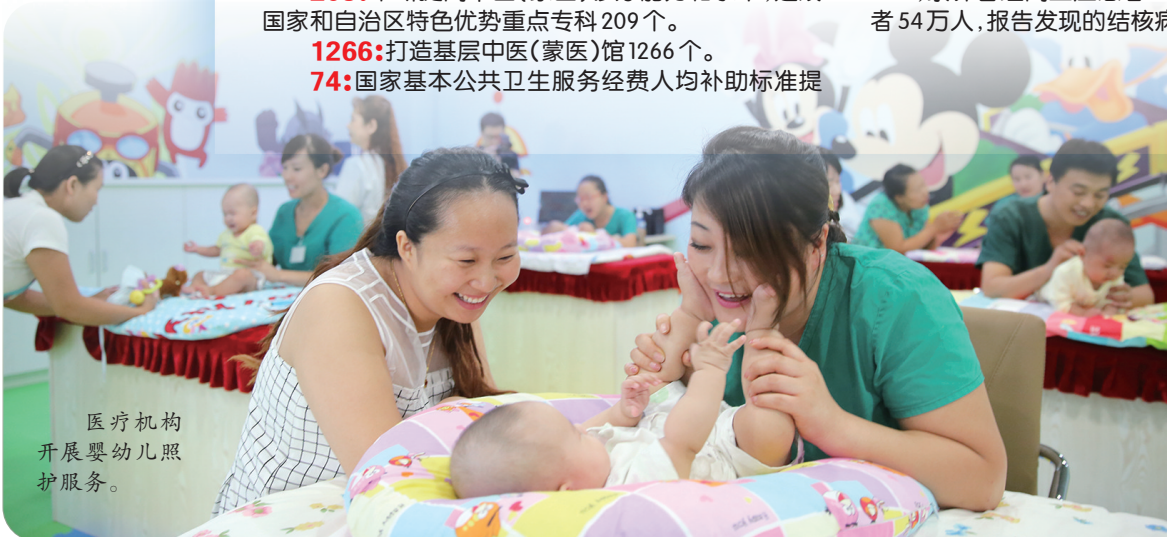
医疗机构开展婴幼儿照护服务。