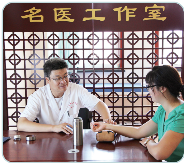
一社区卫生服务中心名医工作室的医生接诊患者。