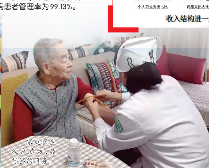
家庭医生入户随访，履行签约服务。