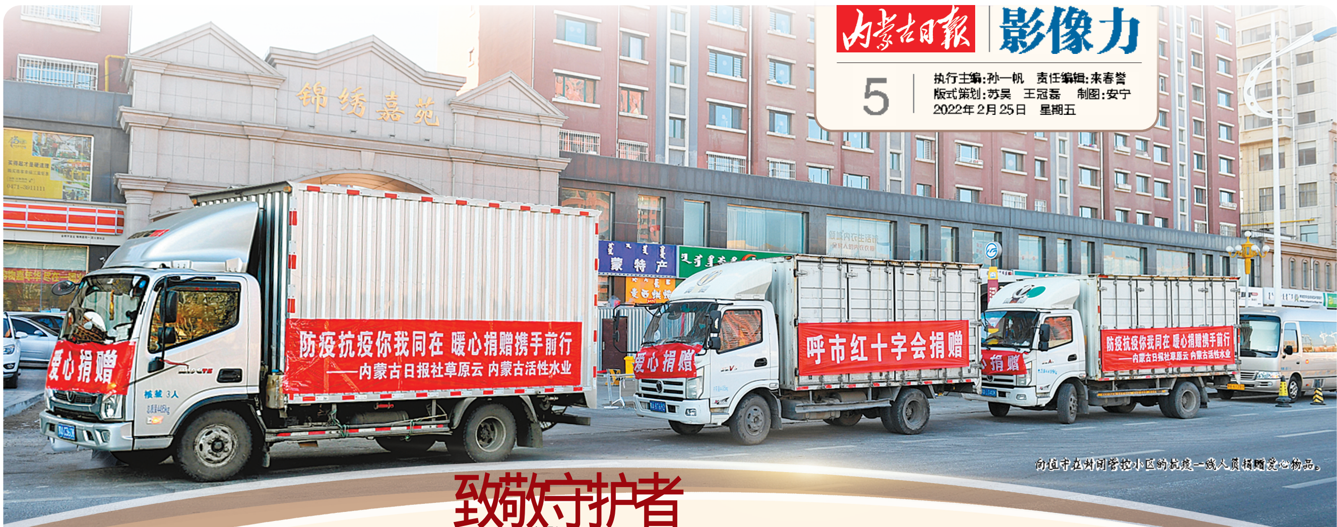
向值守在封闭管控小区的抗疫一线人员捐赠爱心物品。