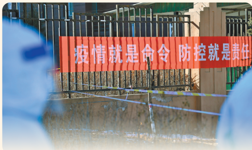
疫情防控 人人有责。