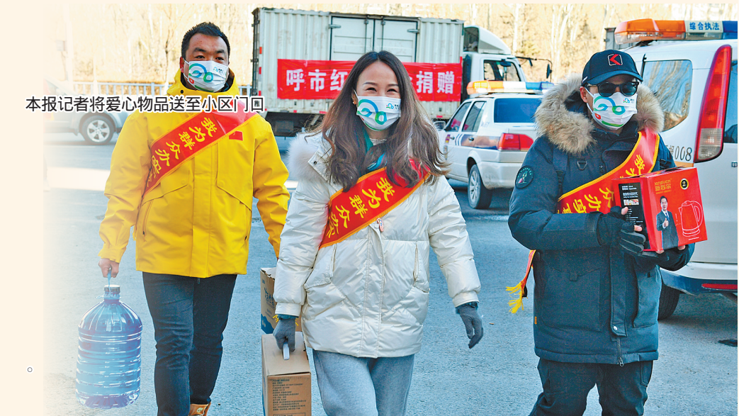
本报将把爱心物品送至小区门口