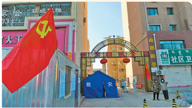
南郡枫景小区门口