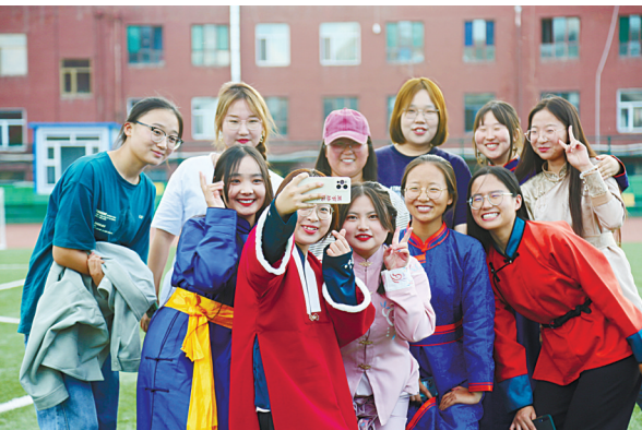
蒙古学学院举办“中华民族一家亲 同心共筑中国梦”2021级新生手拉手结对子活动。