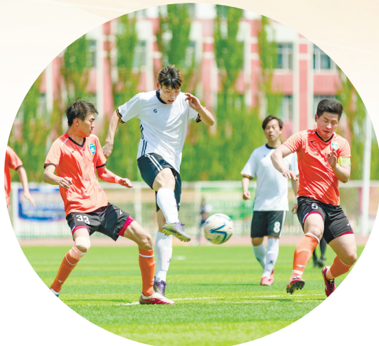
丰富多彩的校园活动。