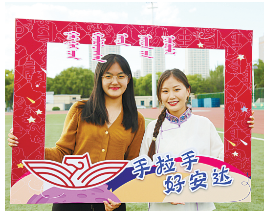
一组结对子的“好安达”。