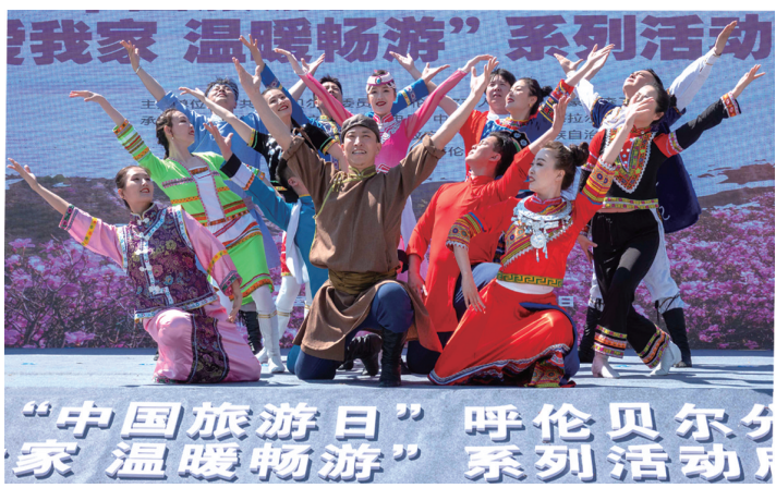
2022年“中国旅游日”呼伦贝尔市活动暨“我家温暖畅游”系列活动启动仪式。