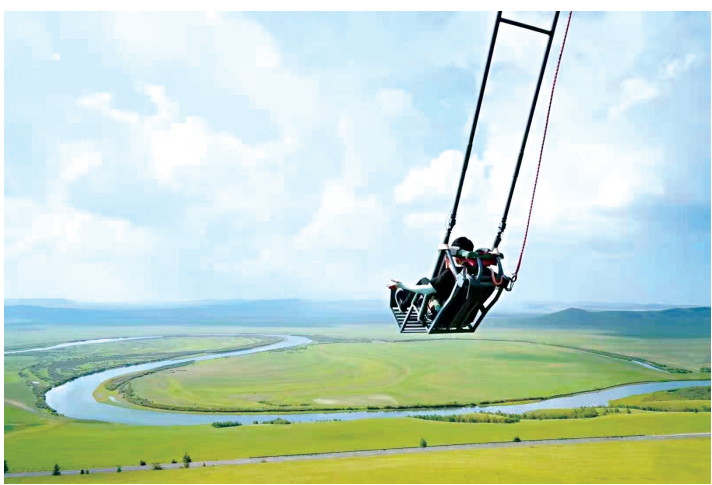
游客在额尔古纳市乌兰山景区打卡“网红秋千”。