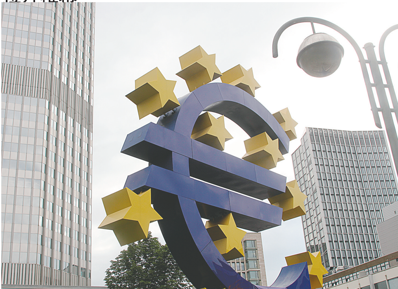
欧元对美元汇率盘中跌破1.01关口

这是7月8日在德国法兰克福拍摄的欧元雕塑。欧洲外汇交易市场8日数据显示，欧元对美元汇率继续下跌，盘中跌破1欧元兑换1.01美元的关口，创近20年来新低，逼近1比1大关。