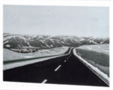
于承佑《通往霍林郭勒的路》。