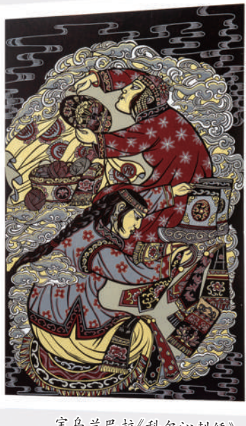
宝乌兰巴拉《科尔沁刺绣》。