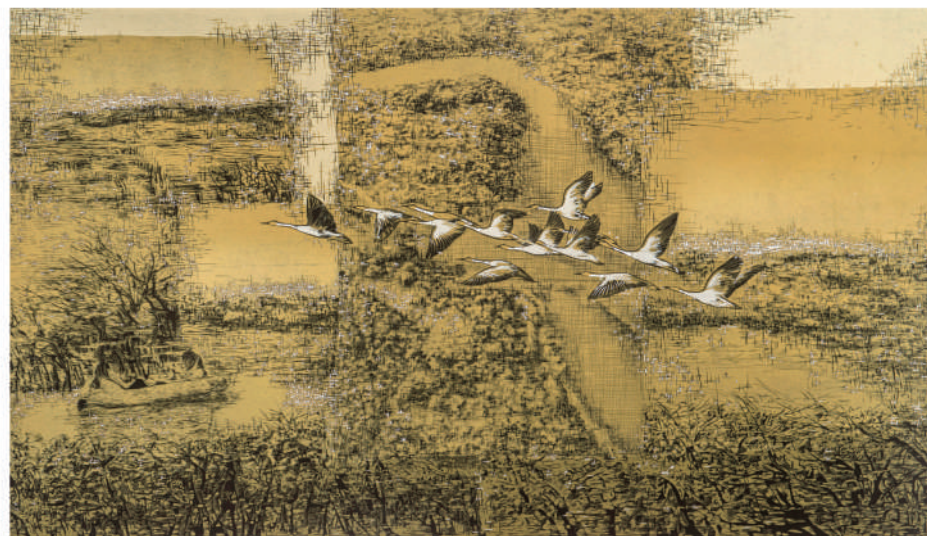
蒋艳玲《沙漠绿洲——大青沟》。